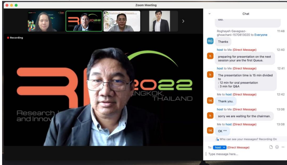
Sponsor branding on virtual event platform

Present your company's innovations in the RI2C industrial session (Example)